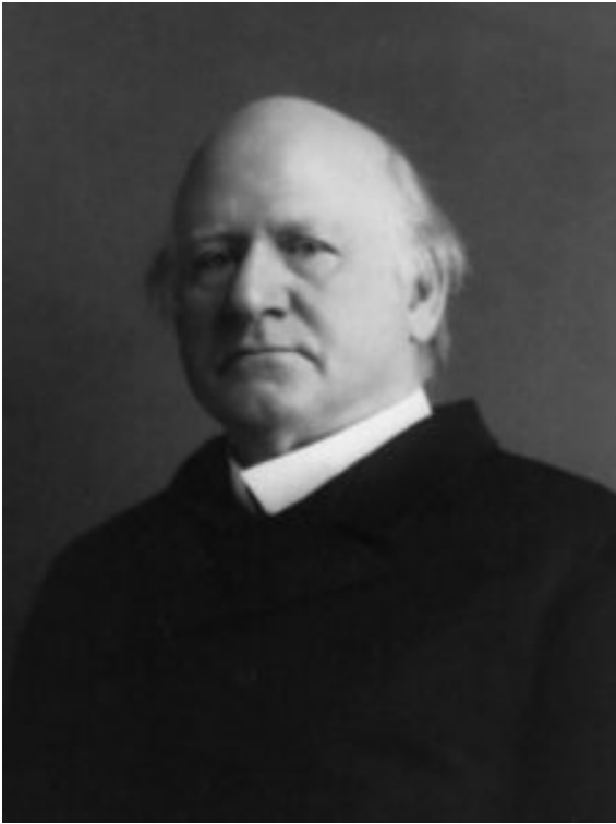
Photographie de John Marshall Harlan, prise entre 1890 et 1910, Library of Congress

John Marshall Harlan est le seul juge à s'opposer à cette décision. Pour lui, le « Separate Car Act » a pour conséquence de restreindre la liberté des citoyens de se déplacer comme ils le souhaitent. Il rappelle que la constitution américaine ne fait aucune distinction entre les citoyens en fonction de leur couleur de peau ou de leur classe sociale, et exclut la possibilité de castes [9] . La séparation évoquée implique à son sens de manière claire une discrimination raciale. Il souligne d'ailleurs que l'objectif du « Separate Car Act » n'est pas tant d'exclure les blancs des wagons réservés aux noirs que d'exclure les noirs des wagons réservés aux blancs. Il évoque le risque que ce type de séparation s'étende à d'autres lieux, comme les rues dont un côté serait réservé aux personnes blanches et l'autre aux personnes noires mais aussi à d'autres types de discriminations (citoyens américains natifs par rapport aux citoyens américains naturalisés, citoyens protestants par rapport aux citoyens catholiques)