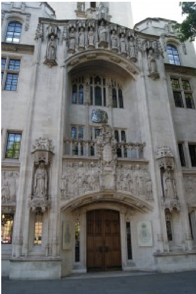
Middlesex Guildhall

Annoncée par la voie d'un simple communiqué de presse par le Premier Ministre Tony Blair en juin 2003, sa création constitue une véritable révolution remettant en cause une institution trouvant ses origines au Moyen-Age.