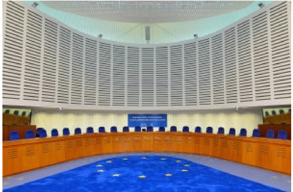
Cour européenne des Droits de l'Homme, Strasbourg

En 1998, le Royaume Uni a adopté le Human Rights Act , entré en vigueur en octobre 2000, qui prescrit une interprétation des lois de manière si possible compatible avec les dispositions de la Convention européenne de sauvegarde des Droits de l'Homme et des libertés fondamentales (CESDH). Il ne s'agit pas d'une transposition pure et simple des dispositions de la CESDH dans le droit anglais, les lois votées par le parlement continuant de prévaloir dans tous les cas. En cas de contrariété entre une norme nationale et une disposition de la CESDH, le juge ne peut en aucun cas invalider la loi. Il ne peut qu'effectuer une «déclaration d'incompatibilité» avec la loi primaire.