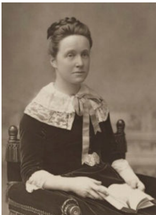
Millicent Fawcette (née Garrett)