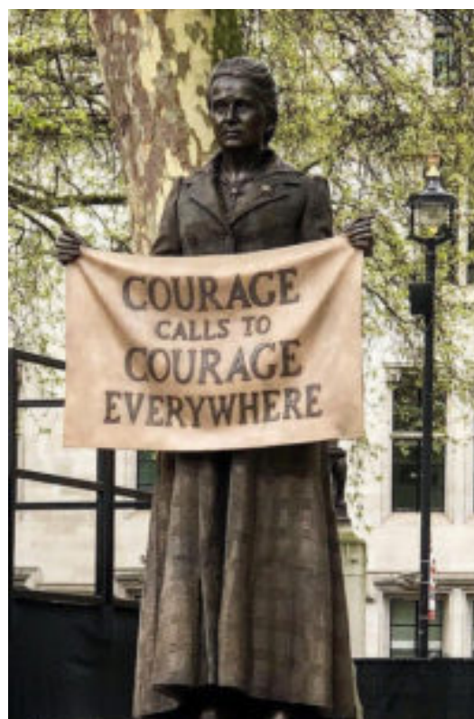
Statue de la suffragiste Millicent Fawcette, réalisée par Gillian Wearing, inaugurée le 24 avril 2018 à Parliament square à Londres

A compter du milieu du 19ème siècle, les femmes tentent au Royaume Uni d'investir la sphère publique réservée aux