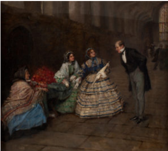
Tableau de Bertha Newcombe « First women's suffrage petition hidden under an apple stall », 1910, représentant Emily Davies et Elizabeth Garrett ayant caché la pétition sous l'étal d'une vendeuse de pommes à Westminster Hall jusqu'à l'arrivée de John Stuart Mill, LSE Library

En mai 1866, Barbara Bodichon interroge Helen Taylor sur l'opportunité de lancer une pétition en faveur du suffrage féminin et le soutien éventuel de son beau père [12] . Helen Taylor se montre d'emblée favorable à cette initiative alors qu'un projet de loi sur la réforme électorale est en discussion devant le Parlement [13] . Elle rédige le premier projet de pétition [14] . John Stuart Mill accepte de son côté de présenter la pétition devant la Chambre des Communes à la condition que celle-ci recueille au moins une centaine de signatures [15] .