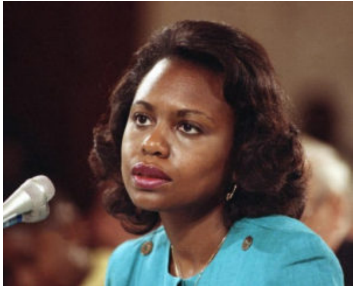
Anita Hill lors de son audition le 11 octobre 1991 par le Comité judiciaire du Sénat des États-Unis

Cinq ans plus tard, une affaire médiatique jette un coup de projecteur sur la question du harcèlement sexuel. Des millions de téléspectateurs américains assistent en direct en octobre 1991 à l'audition d'Anita Hill accusant le juge Clarence Thomas, candidat à la Cour suprême des États-Unis, de harcèlement sexuel [11] .