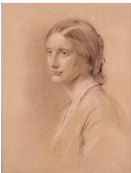
Josephine Elizabeth Butler (née Grey), par George Richmond, 1851, National Portrait Gallery , London

En 1877, Annie Besant (1847-1933) décide de faire publier avec Charles Bradlaugh la brochure d'un médecin américain, Charles Knowlton, Fruits of Philosophy , relative au contrôle des naissances et aux moyens pour y parvenir. Ils sont tous deux condamnés à une peine de prison, qu'ils n'effectuent cependant pas, la décision étant annulée en appel pour vice de forme. Ce procès joue un rôle important dans la création de la Malthusian League (la Ligue Malthusienne) en 1877, qui est la première organisation ayant pour objectif la diffusion de l'information sur le contrôle des naissances [21] .