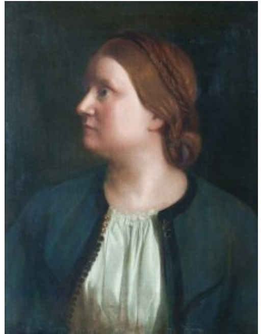
Barbara Leigh Smith Bodichon, par Samuel Laurence (1812–1884), Girton College, University of Cambridge

La position de Barbara Leigh Smith concernant les droits accordés aux femmes mariées est plus tranchée que celle de Caroline Norton. Selon elle, la doctrine de la coverture (ou couverture) produit un système en soi profondément injuste. Elle ne considère pas, à l'instar de Caroline Norton, que les problèmes des femmes surviennent uniquement en cas de mariages malheureux, lorsque l'époux n'assume pas son devoir de protection. Elle relève qu'heureuse ou pas en mariage, une femme demeure une adulte et doit pouvoir posséder des biens en son nom propre [5] .