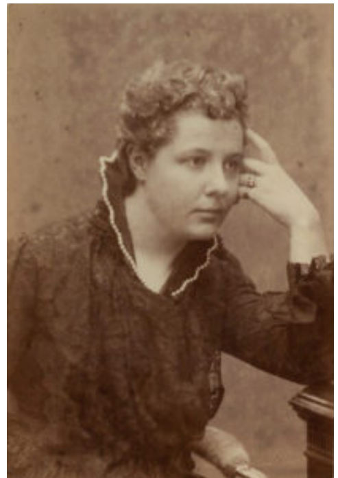
Annie Besant (née Wood), par Hayman Seleg Mendelssohn, milieu des années 1880, National Portrait Gallery , London