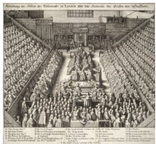
Gravure du procès en destitution de Thomas Wentworth, 1er Comte de Strafford, en 1641, Thomas