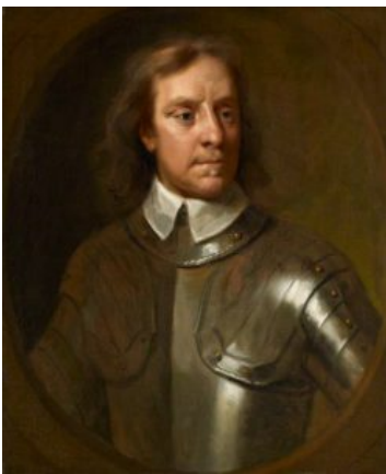
Oliver Cromwell, par Samuel Cooper, 1656, National Portrait Gallery

Durant la guerre civile, le Parlement emprisonne allègrement pour des motifs divers comme «tenir des propos diffamatoires» ou «ne pas soutenir l'effort militaire». Par ordonnances, il crée des comités militaires ou religieux, qui usent également de leurs pouvoirs pour emprisonner. Désormais, la détention arbitraire est surtout le fait du Parlement. Commence alors un bras de fer entre la King's Bench et le Parlement qui va durer des décennies.