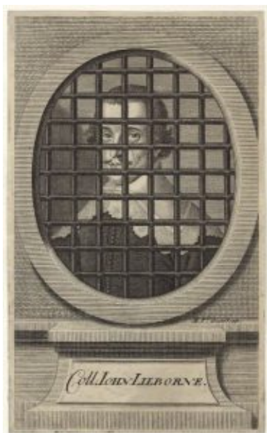
John Lilburne, par Michael Vandergucht, 1713, National Portrait Gallery

avril 1653 (dissolution du Parlement par Cromwell), l'exécutif (le Conseil d'Etat) et le Parlement, sur la même longueur d'ondes, collaborent étroitement.