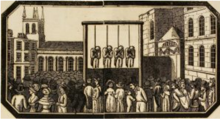
Illustration d'une publication (Broadside) à l'occasion de l'exécution de Joseph Hunton, 1828

Dans le premier épisode, Garrow défend Peter Pace, qui, bien qu'innocent, est accusé par un célèbre thief taker , Edward Forrester, d'un vol à main armée. La parole du thief taker l'emporte sur celle de Pace qui est déclaré coupable par le jury et condamné à la peine de mort par pendaison.