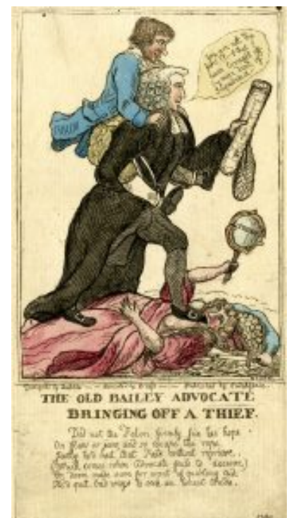
Dessin satirique « The Old Bailey Advocate bringing off a thief » , 1789, British