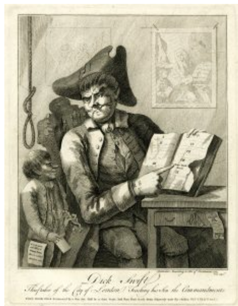
Dessin satirique, Dick Swift Thieftaker of the City of London Teaching his Son the Commandments , 1765,