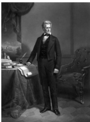
Andrew Jackson, septième Président des Etats-Unis de 1829 à 1837, peinture de D.M. Carter gravée par A.H. Ritchie, 1860, Library of Congress

Au sein des treize premières colonies, les juges sont désignés par le pouvoir exécutif (gouverneur) ou législatif ou enfin par le pouvoir exécutif sous réserve d'une confirmation par le pouvoir législatif. Le premier Etat à introduire une sélection des juges par le biais d'élections populaires est la Georgie en 1812 pour les juges de premières instance. Vingt ans plus tard, le Mississippi va plus loin et décide d'élire au suffrage populaire l'ensemble des juges siégeant dans une juridiction de l'Etat.