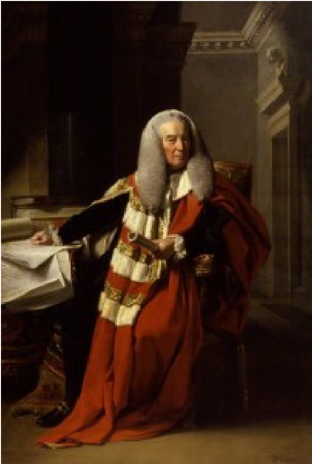
William Murray, 1er Comte de Mansfield, par John Singleton Copley, 1783, National Portrait Gallery, Londres

Le juge Lord Mansfield, considéré comme le fondateur du droit commercial en Angleterre, aurait ainsi indiqué, en 1773, que les jurés suivaient dans la plupart des cas ses instructions (sauf lorsqu'il s'agissait de causes «politiques»).