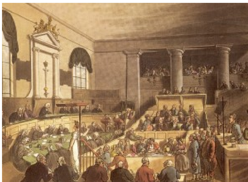
Illustration d'un procès au tribunal pénal d'Old Bailey à Londres, ouvrage « The Microcosm of London » Vol. 2., 1808.

Le pouvoir du jury pénal est à son apogée au 18e siècle en Angleterre et au pays de Galles. Les procès avec jury sont nombreux et sont menés très rapidement : en moyenne une demi-heure par affaire. Les jurés ne se retirent pas toujours pour délibérer et rendent leur décision at the bar (en France, on dirait plutôt « sur le siège »). Il faut dire que jusqu'en 1858, les jurés sont laissés sans feu, sans eau et sans nourriture