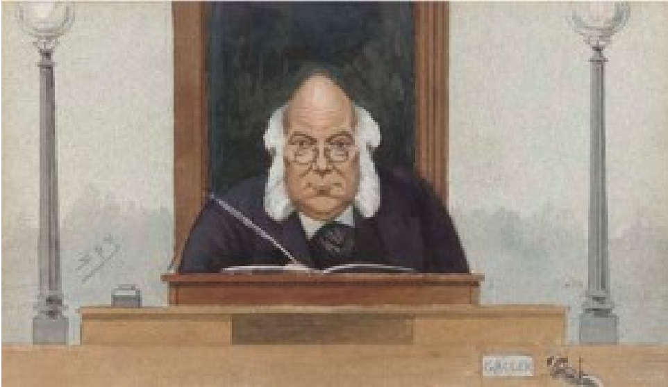
Caricature d'un « magistrate » dans la revue anglaise Vanity Fair , 1891

L'accroissement des attributions judiciaires des magistrates (juges non professionnels) encore appelés juges de paix ( justices of the peace, JPs ) va avoir un impact direct sur l'intervention du jury dans le procès pénal. Une série de lois [8] à partir de 1827 ont pour conséquence d'augmenter sensiblement le nombre des summary offences , infractions pouvant, par une procédure simplifiée, être jugées directement par les magistrates sans jury. La summary procedure (procédure sommaire) n'est pas nouvelle. Dès le règne d'Edward III au 14ème siècle, la tâche est confiée aux juges de paix ( justices of the peace ), dont les fonctions sont principalement d'ordre administrative, de juger les petites infractions, afin d'éviter de réunir un jury [9] . Dès 1865, le juriste Blackstone met en garde contre le développement des procédures sommaires et ses conséquences sur le procès avec jury [10] .