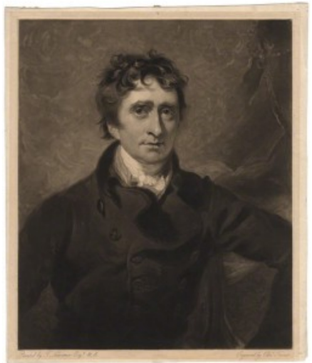
Thomas Erskine, 1st Baron Erskine, par Charles Turner, 1806, National Portrait Gallery