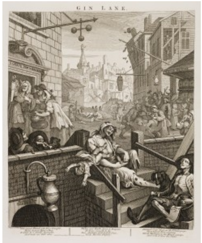
Gin Lane (la rue du Gin), gravure de William Hogarth dans « Beer Street and Gin Lane », 1751

Dans chaque paroisse, un ou deux constables sont désignés parmi les propriétaires pour une durée d'une année. Leur rôle est d'appréhender les suspects d'infractions et de les présenter devant le juge de paix. Ils exercent à titre bénévole et à temps partiel.