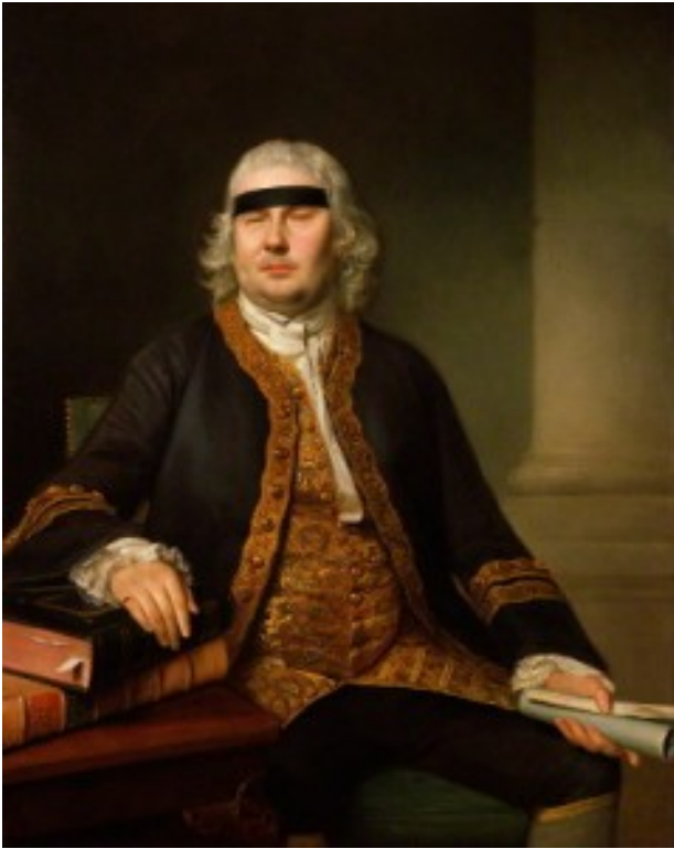
John Fielding, par Nathaniel Hone, 1762, National Portrait Gallery

Il poursuit les réformes entamées par son frère :