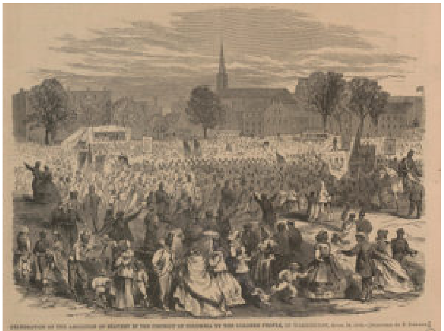
Gravure de Frederick Dielman (1866) Celebration of the abolition of slavery in the District of Columbia by the colored people, in Washington, Library of Congress

L'abolition de l'esclavage en 1865 avec la ratification du treizième amendement à la constitution des Etats-Unis ne règle pas la question du statut et des droits des afro-américains. Très vite, des Etats du Sud adoptent de nouvelles législations restreignant les droits des esclaves affranchis (parfois appelées « Black Codes » ).