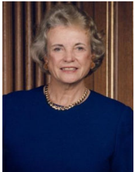
La juge suprême Sandra Day O'Connor qui a rédigé l'opinion de l'arrêt unanime Harris v. Forklift Systems

En 1993, dans l'arrêt Harris v. Forklift Systems [6] , la Cour suprême indique que l'environnement de travail doit être évalué en prenant comme référence la « personne raisonnable ». Elle estime qu'un harcèlement sexuel ne peut être reconnu que s'il apparaît qu'une « personne raisonnable », placée dans les mêmes circonstances que la victime, aurait perçu cet environnement comme hostile ou abusif. Sous cette réserve, la