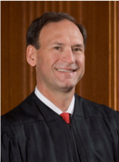
Le juge suprême Samuel Alito, en 2007

En 2013, la Cour suprême donne une définition plus restrictive des personnes assimilées à un supérieur hiérarchique. Dans une décision partagée à 5 contre 4, elle définit désormais les supérieurs hiérarchiques comme les personnes disposant du pouvoir de recruter et de licencier (arrêt Vance v. Ball State University du 24 juin 2013 [10] ). Elle rejette la définition plus large qui était adoptée par l' Equal Employment Opportunity Commission (EEOC) qui englobait les personnes chargées de gérer, contrôler le travail quotidien d'un autre salarié.