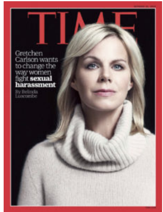
Couverture du Time Magazine du 31 octobre 2016 avec Gretchen Carlson, ex-présentatrice vedette de la chaîne de télévision Fox News

L'affaire Anita Hill en 1991 joue un rôle déclencheur [15] . Plusieurs affaires dans les années 1990 (notamment des class actions ) aboutissent à l'allocation de dommages et intérêts importants pour les victimes. Les entreprises prennent conscience qu'elles peuvent être condamnées à des dommages et intérêts punitifs et compensatoires. Elles sont plus nombreuses à établir des codes de bonne conduite abordant la question du harcèlement sexuel. Ces codes précisent les règles et valeurs à respecter au sein de l'entreprise, rappellent l'interdiction du harcèlement sexuel et la procédure interne de signalement.