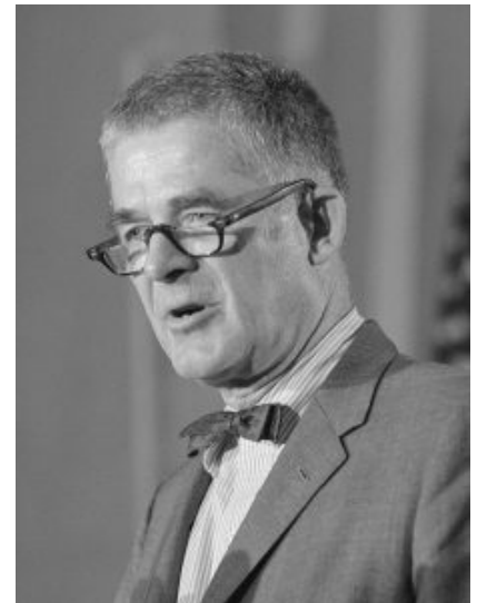
Archibald Cox, à une conférence de presse, le 4 juin 1973