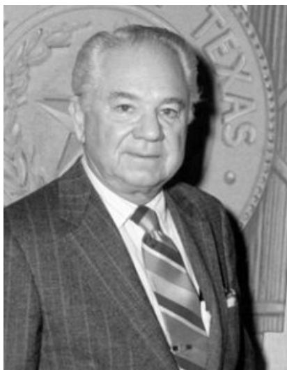
Leon Jaworski

intervient alors auprès de l'adjoint du ministre de la justice, William Ruckelshaus, qui décide également de démissionner. Il intercède enfin le même jour auprès du numéro 3 du ministère de la justice, Robert Bork, qui accepte de mettre fin à la mission de Cox («le massacre du samedi soir») [16] .