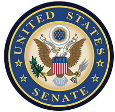
Sceau du Sénat américain

En 2005, le président Bush a retiré la candidature d'Harriet Miers, ancienne conseillère juridique de la Maison-Blanche, à la demande de cette dernière, avant même son passage devant le Sénat en raison des vives critiques émises suite à sa nomination par des sénateurs des deux bords [4] .