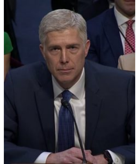
Le juge Neil Gorsuch.

des sessions du Sénat. Il s'agit d'une nomination temporaire qui est valide uniquement jusqu'à la fin de la prochaine session parlementaire et qui est soumise a posteriori au Sénat [13] .