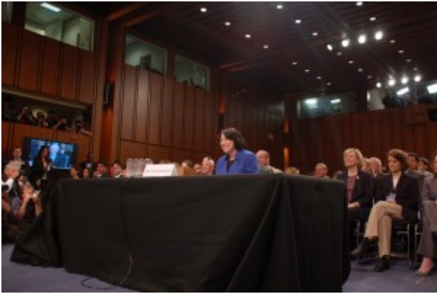
Sonia Sotomayor, le 1er jour de l'audience de confirmation le 13 juillet 2009

Avant son audition, le candidat doit compléter un questionnaire très détaillé relatif à son curriculum vitae (postes tenus, publications, expérience de l'enseignement, implications au niveau politique, éventuels conflits d'intérêts, etc.) et sa situation financière. En parallèle, le Federal Bureau of Investigation (F.B.I.) effectue une enquête et adresse au Comité des compte-rendus confidentiels. L' American Bar Association (ABA) évalue les compétences professionnelles de l'intéressé [9]. Le candidat doit rendre des visites de courtoisie à l'ensemble des membres du Sénat dans leur bureau. Les groupes de pression largement mobilisés envahissent le champ médiatique pour vilipender ou encenser le candidat.