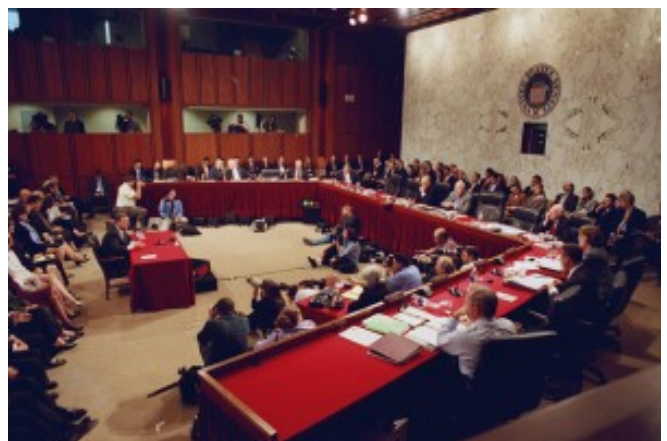
« Audience de confirmation » de

Avant son audition, le candidat doit compléter un questionnaire très détaillé relatif à son curriculum vitae (postes tenus, publications, expérience de l'enseignement, implications au niveau politique, éventuels conflits d'intérêts, etc.) et sa situation financière. En parallèle, le Federal Bureau of Investigation (F.B.I.) effectue une enquête et adresse au Comité des compte-rendus confidentiels. L' American Bar Association (ABA) évalue les compétences professionnelles de l'intéressé [9]. Le candidat doit rendre des visites de courtoisie à l'ensemble des membres du Sénat dans leur bureau. Les groupes de pression largement mobilisés envahissent le champ médiatique pour vilipender ou encenser le candidat.