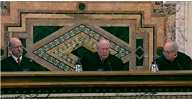
Formation collégiale de la Cour d'appel

Les United States federal courts of appeal judges sont les juges des cours d'appel fédérales. On parle également de circuit judges . Ils siègent en formation collégiale de trois juges. Il n'y a pas de jury. Ils statuent en appel sur les décisions rendues par les tribunaux de district du circuit. Le président de la cour d'appel est également appelé Chief judge .