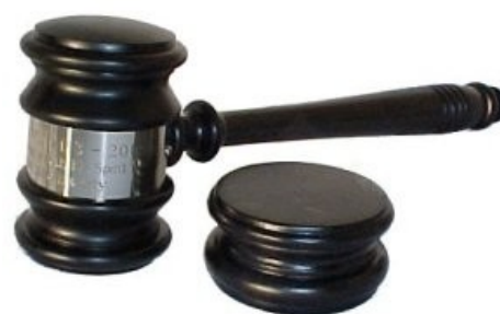
Marteau du juge, The Gavel Store

d'audience des juges américains. Certains juges président aujourd'hui les audiences en tenue de ville. La tendance est en tout état de cause à la simplicité, notamment depuis 1801 sous l'influence de John Marshall, président de la Cour suprême jusqu'en 1835, avec le port d'une robe noire sans fioriture. La perruque, attribut du juge anglais, n'est plus portée vers la fin du 18ème – début 19ème. On raconte qu'elle aurait été décrite par Thomas Jefferson, troisième président des Etats-Unis, comme « monstrueuse » [1] .