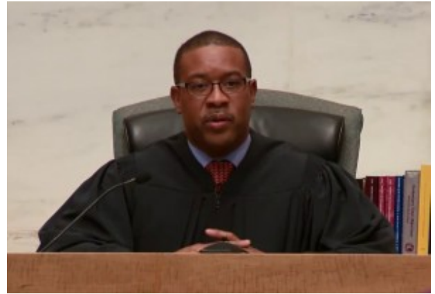
« Pathways to the Bench: U.S. Bankruptcy Judge Jeffery P. Hopkins » , www.uscourts.gov , Youtube

Les bankruptcy judges sont des juges spécialisés en matière de faillites. Ils exercent au sein d'une juridiction, le United States bankruptcy court , qui est rattachée au tribunal de district. Ils ne bénéficient pas du statut de l'article III de la constitution. Ils sont recrutés pour une durée de 14 ans renouvelable par la Cour d'Appel du Circuit fédéral dont dépend le district. Ils sont au nombre de 352.