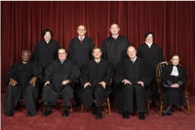
Photo officielle de la Cour suprême, 2010, par Steve Petteway, https://www.oyez.org/courts

intellectuelle (brevets, marques, etc), certaines demandes pécuniaires des fonctionnaires fédéraux, des anciens combattants, des agents de la sécurité publique. Elle statue sur les appels de décisions des tribunaux de districts, de juridictions spécialisées comme la Cour fédérale des plaintes ( United States Court of Federal Claims ), de la Cour fédérale du commerce international ( U.S. Court of International Trade ) et la Cour fédérale d'appel pour les requêtes des anciens combattants ( U.S. Court of Appeals for Veterans Claims ) ou d'agence administratives comme le United States Merit Systems Protection Board , les Boards of Contract Appeals , le Patent Trial and Appeal Board , et le Trademark Trial and Appeals Board .